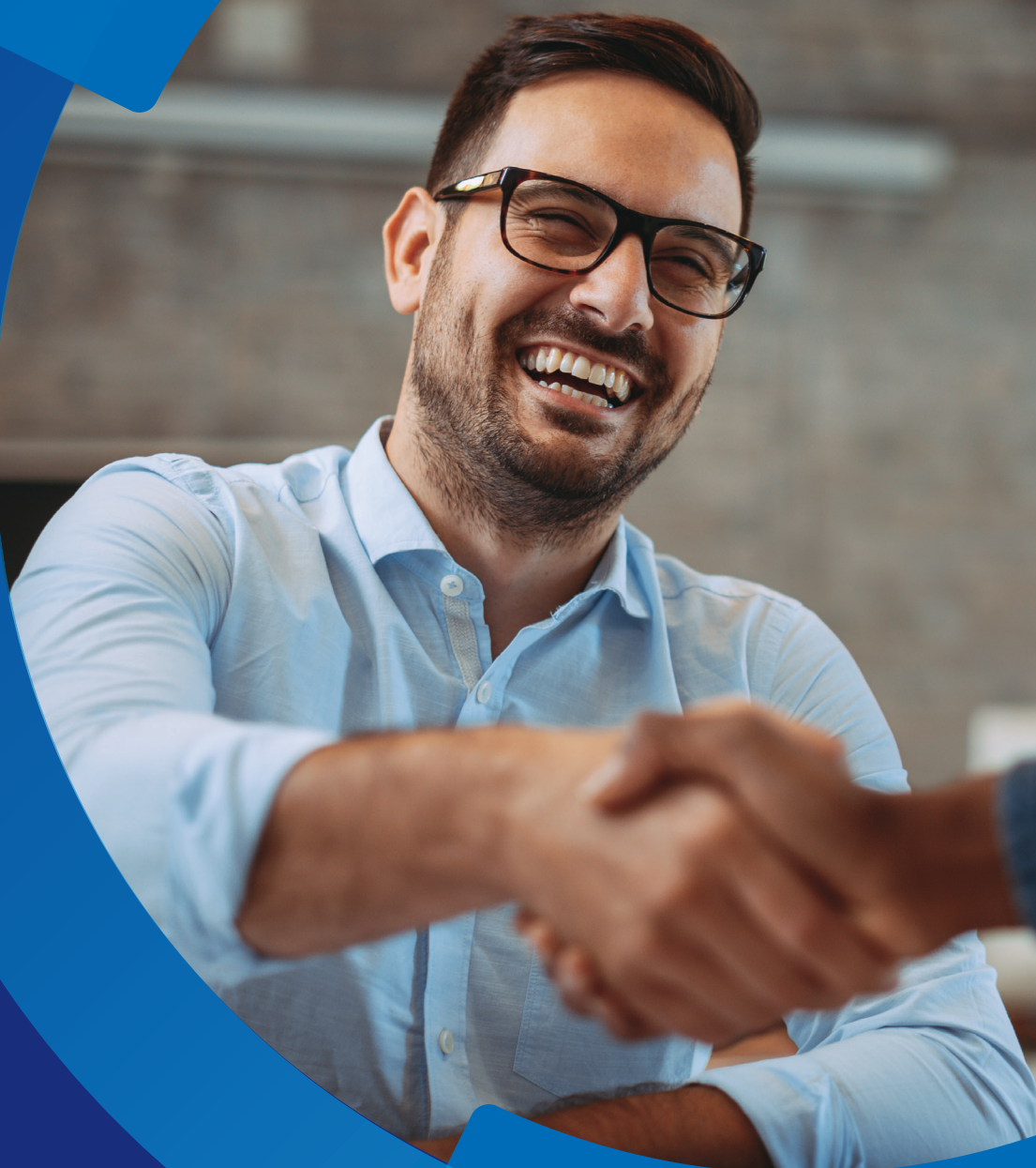
Tabela de Preços Minas Gerais

Válida a partir de 15 de outubro de 2019